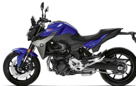
BMW F 900 R San Marino blau metallic N2X / Sitzbank schwarz *2 (Tankmittelcover und Kühlerblende Granitgrau metallic matt / Vorderradkotflügel in San Marino blau metallic / Gabelstandrohre schwarz eloxiert / Felgen Nachtschwarz)