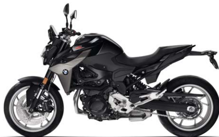
BMW F 900 R Blackstorm metallic ND2 / Sitzbank schwarz (Tankmittelcover und Kühlerblende Granitgrau metallic matt / Vorderradkotflügel Nachtschwarz uni matt / Gabelstandrohre schwarz eloxiert / Felgen Weißaluminium)

Die neue BMW F 900 R ist voraussichtlich ab Frühjahr 2020 beim BMW Motorrad Partner erhältlich.