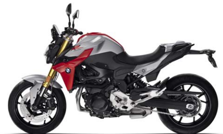
BMW F 900 R Sport Hockenheim Silber metallic / Racingred uni N3A / Sitzbank schwarz *3 (Details siehe Ausstattungsvarianten)